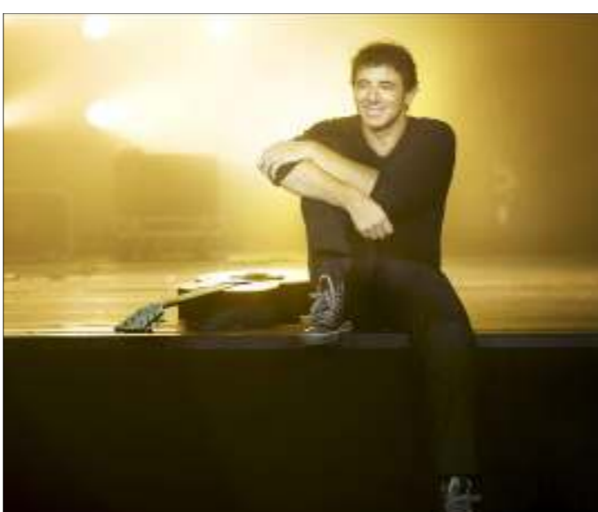
VENDREDI 12 DÉCEMBRE. Cet automne, Patrick Bruel sera sur la route en version acoustique pour un rendez-vous unique. Il profitera de salles plus intimes pour peaufiner les chansons de son prochain album. A 20 h, au Vinci, à Tours. Tarifs : 45 € à 48 €. Renseignements au 02.47.70.70.70.