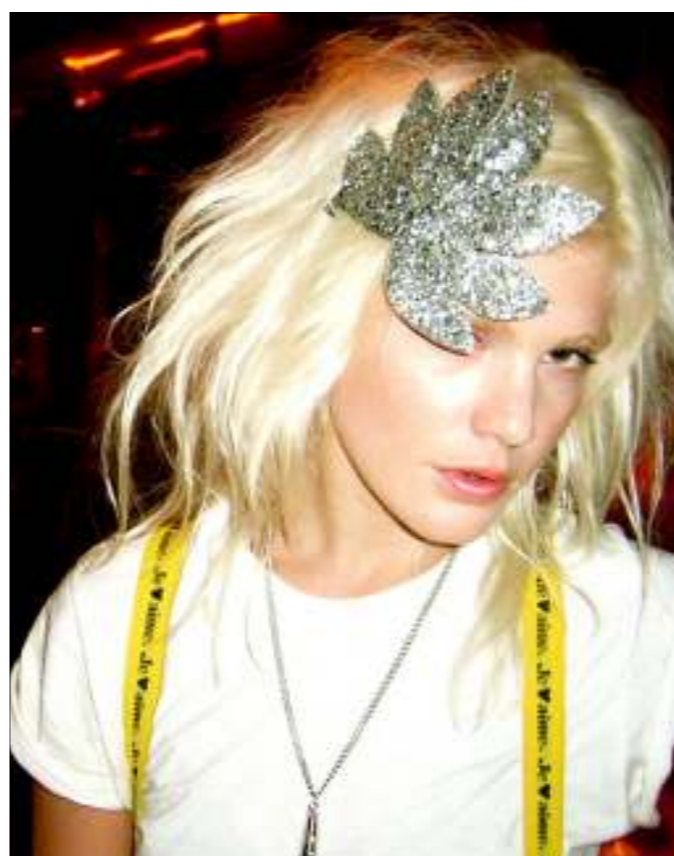
JEUDI 13 NOVEMBRE. Allure mutine, délicate pop acidulée, déjà disque d'or, l'australienne Micky Green est en train de conquérir la France. A découvrir sur scène ! A 20 h 30, à L'Escale, à Saint-Cyr-sur-Loire. Tarif : 25 €. Renseignements au 02.47.49.80.03.