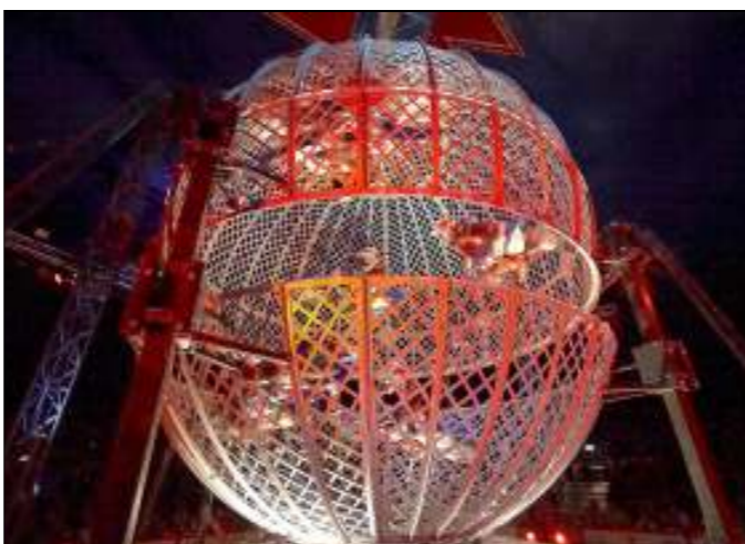
LES 26, 27 ET 28 SEPTEMBRE. Le meilleur des cirques du monde revient au Grand Hall avec un nouveau spectacle et de nouveaux artistes pour le 2 e festival de cirque de Tours. A 14 h 30 et 20 h 30 vendredi et samedi, 14 h 30 dimanche, au Grand Hall, à Tours. Tarifs : 15 € à 37 €. Renseignements au 02.47.32.37.10.