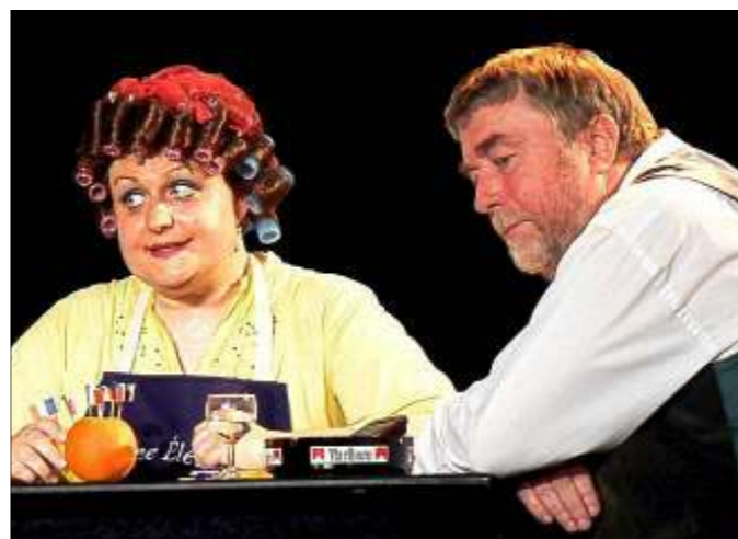
DIMANCHE 28 SEPTEMBRE. Primé dans de nombreux festivals, « Tant qu'à pleurer sur son sort... » sera en compétition lors du 10 e festival des Devos de l'humour. Un tour de chant déjanté à savourer sans modération. A 18 h 30, salle Raymond-Devos, à Monnaie. Tarifs : 13 € à 25 €. Renseignements au 02.47.56.13.14.