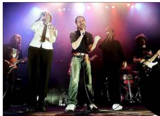
JEUDI 2 OCTOBRE. Originaire de Picardie, les Fatals Picards, sympathique quatuor de composition « classique », donnent dans la chanson festive. A découvrir rien que parce qu'ils ont survécu à l'Eurovision ! A 20 h 30, salle des fêtes de Saint-Pierre-des-Corps. Tarifs : 10 € à 14 €. Renseignements au 02.47.63.43.15.