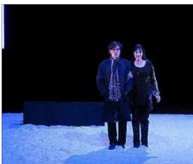
LES 2, 3, 4 ET 5 DÉCEMBRE. Comédie dramatique de Jon Fosse, « Hi-ver » relate une rencontre toute simple : sur un banc d'un jardin public, une femme incohérente s'adresse soudain à un homme sans passion. A 20 h, sauf, jeudi, à 19 h, au Nouvel Olympia, à Tours. Tarifs : 7 € à 19 €. Renseignements au 02.47.64.50.50.