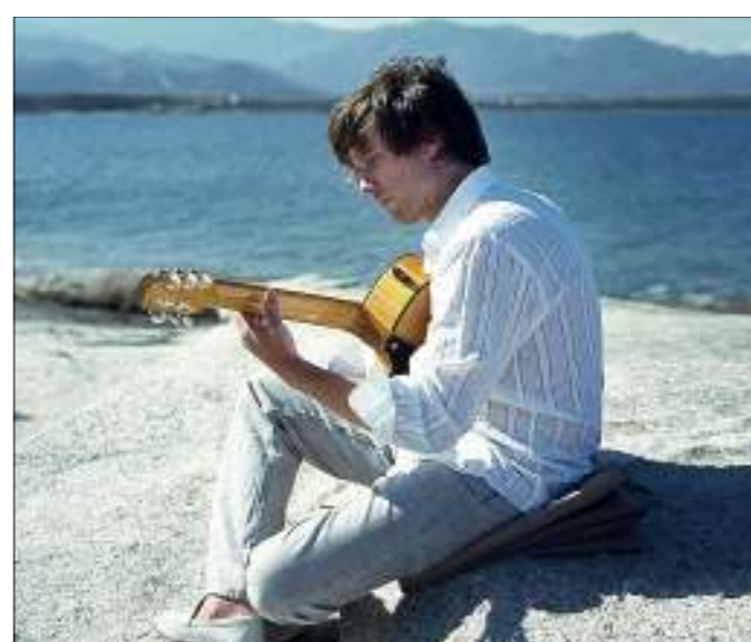
VENDREDI 5 DÉCEMBRE. Thomas Dutronc, accompagné de son quartet Les Esprits manouches, réanime les essences tziganes jusqu'à rendre accessible par le plaisir ce jazz de Django qu'il aime tant. Mieux qu'un concert, un spectacle. A 20 h 30, à L'Escale, à Saint-Cyr-sur-Loire. Tarif : 27 €. Renseignements au 02.47.49.80.03.