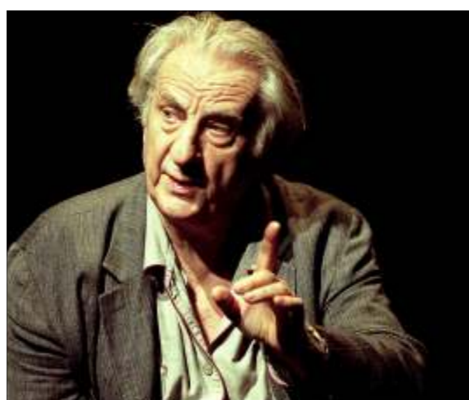
MARDI 16 DÉCEMBRE. Interprété par Michel Aumont, « A la porte » est le monologue intérieur d'un vieillard rendu à sa solitude à cause d'une porte malencontreusement refermée dans son dos. A 20 h 30, à l'espace Malraux, à Joué-lès-Tours. Tarifs : 17,50 € et 20 €. Renseignements au 02.47.53.61.61.