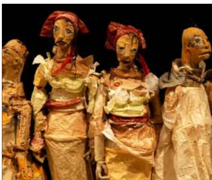
LES 4 ET 5 NOVEMBRE. Tentative de défroissage du mythe, « Une Antigone de papier » raconte une histoire de famille où des personnages vont se déchirer, des murs s'effondrer et des armées s'affronter. A 20 h, sauf, jeudi, à 19 h, au Nouvel Olympia, à Tours. Tarifs : 7 € à 19 €. Renseignements au 02.47.38.31.30.