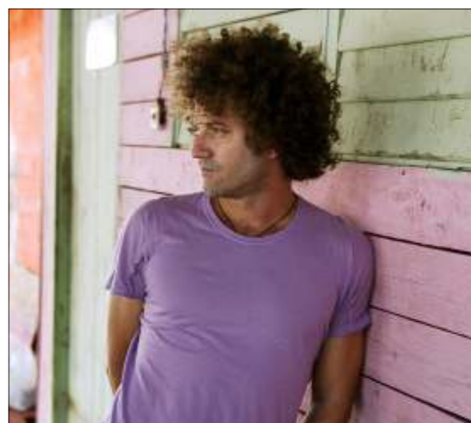
SAMEDI 15 NOVEMBRE. Icône de la nouvelle chanson cubaine, Raul Paz s'affirme comme un grand de la musique latine. Après dix ans de tournées, il sera à Avoine avec son dernier album. A 20 h 30, au centre culturel d'Avoine. Tarifs : 10 € à 15 €. Renseignements au 02.47.98.11.15.