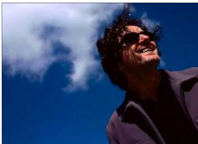
JEUDI 18 SEPTEMBRE. Révélé par ses compositions pour les films de Kusturica, Goran Bregovic sera au festival Jazz en Touraine avec son orchestre des Mariages et des Enterrements. Un concert événement ! A 21 h, à l'espace Ligéria, à Montlouis. Tarifs : 20 € à 28 €. Renseignements au 02.47.45.00.16.